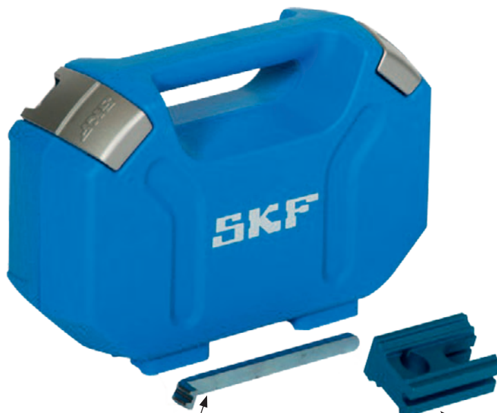
VKN 1003-2 OEM # KM 911