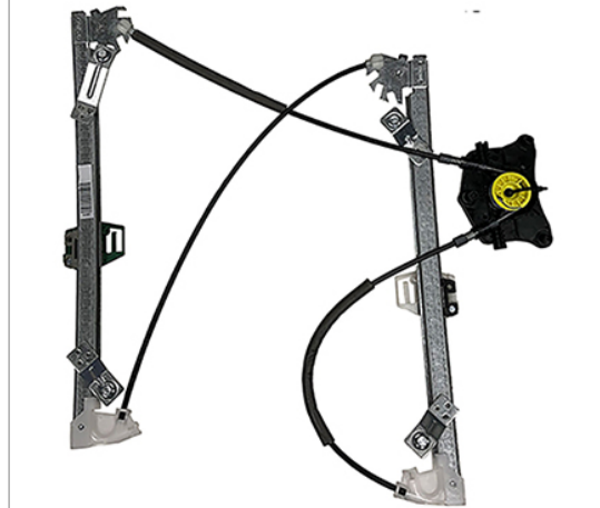
POWER WINDOW LWFT ALZACRISTALLI LETTRICO SX

THIS INSTALLATION INSTRUCTION IS FOR BOTH LEFT AND RIGHT SIDE. CETTE INSTRUCTION DE MONTAGE EST POUR LES DEUX COTES DROIT ET GAUCHE. DIESE MONTAGE-ANLEITUNG IST FÜR DIE BEIDE LINKE UND RECHTE SEITE. ESTA INSTRUCCION DE MONTAJE ES PARA LOS DOS LADOS IZQUIERDO Y DERECHO. ESTAS INSTRUÇÕES VALEM TANTO PARA O LADO ESQUERDO QUANTO PARA O DIREITO. LA PRESENTE ISTRUZIONE VALE SIA PER IL LATO SINISTRO CHE PER IL LATO DESTRO.