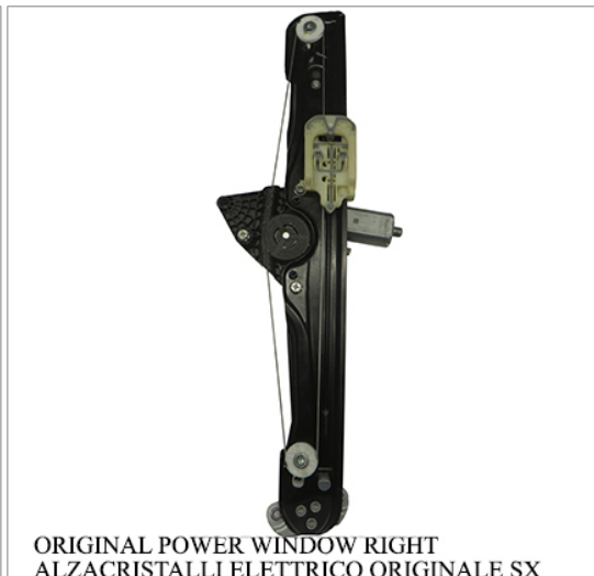
ORIGINAL POWER WINDOW RIGHT ALZACRISTALLI ELETTRICO ORIGINALE SX